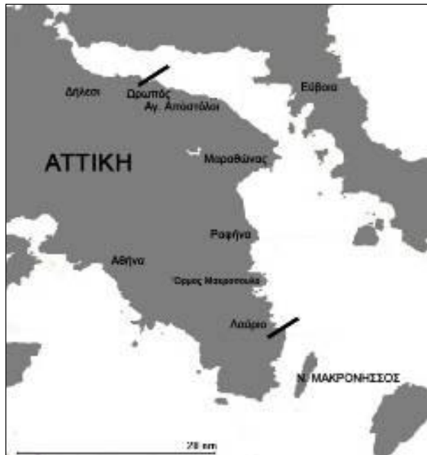
Σχήμα 1. Περιοχή μελέτης

Γεωλογικά, η περιοχή μελέτης εντάσσεται στην ευρύτερη μεταλπηκή ηπειρωτική λεκάνη της Αττικής-Βοιωτίας-Εύβοιας της οποίας η δημιουργία οφείλεται στη δράση νεοτεκτονικών ρηγματών που έδρασαν από το Μειόκαινο έως σήμερα. Οι μεταλπηκοί σχηματισμοί έχουν τη βάση τους στο Μειόκαινο και αντιπροσωπεύονται από διάφορα ιζήματα χερσαίας και λιμναίας φάσης, τα οποία και συναντάμε στην ευρύτερη περιοχή του σημερινού νότιου Ευβοϊκού κόλπου (Παπανικολάου et al., 1988).